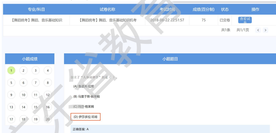
图【舞蹈统考】查看成绩界面