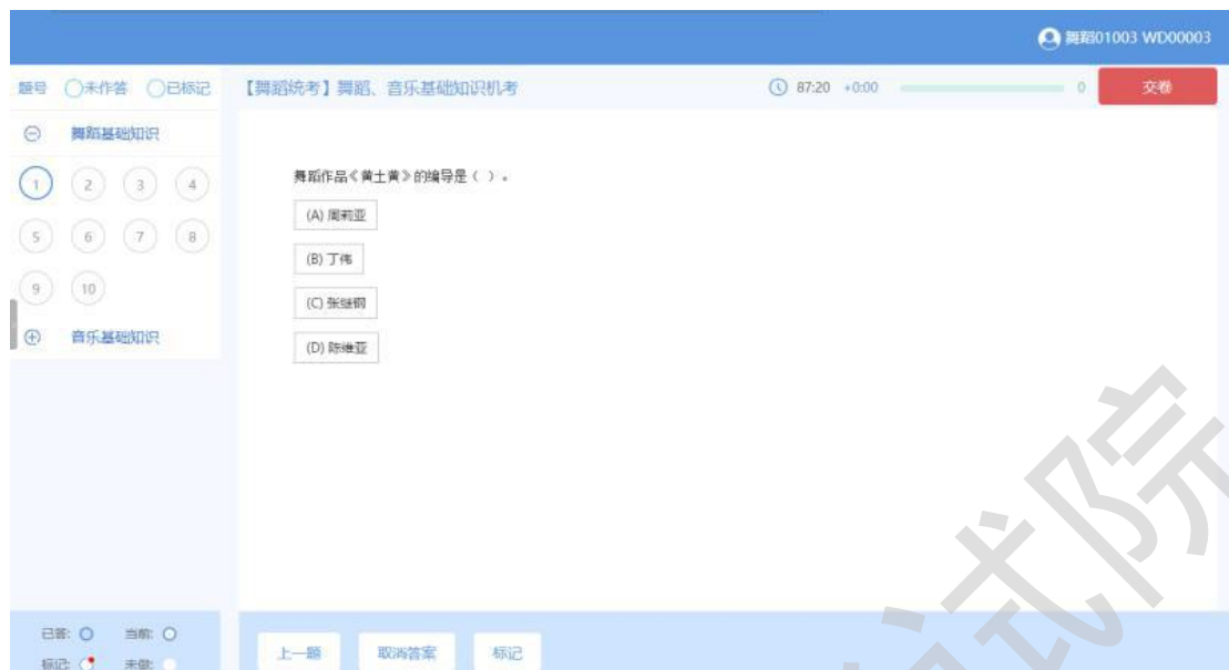
图【舞蹈统考】考试界面